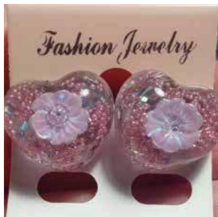
Laboratorio artigianale artistico "ATLANTIS" di Asia Rignano Flaminio